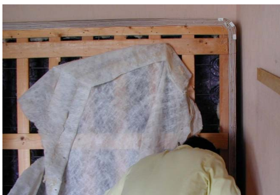
Saib tag rog lus txaj thiab ntug txaj