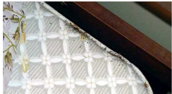
Soj ntsuam ntug txaj seb puab muaj kab uas tom neeg saum txaj

Soj ntsuam txhua txhua qov chaws nyob rau hauv lus ntug txaj. Lus taub hau thiab ko taws txaj yog qov chaws uas cov kab no nyiam nyob tshaj. Soj ntsuam saib tag nrho tej qhov nyob rau hauv lub txaj.