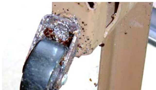
Tshem cov ntaub uas ntej koj soj ntsuam lus ntug txaj

Tsem tag nrho cov tub rau khoom thiab soj ntsuam txhua txhua qov chaws. Tsem tej khoom nyob hauv lus tub rau