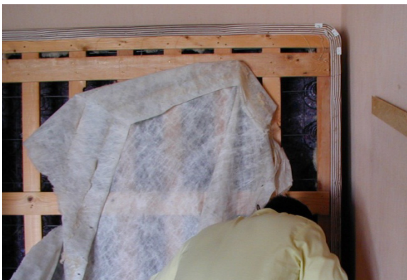
Gỡ bỏ vải bọc khi kiểm tra bọc kê nệm

Lặp lại việc tìm kiếm tương tự này như với bọc kê nệm. Điểm khác nhau duy nhất là bọc kê nệm thường có tấm bảo vệ cạnh bằng nhựa và miếng vải lỏng được gọi là "vải bọc" ghim lên mặt dưới. Những đường may nổi và cạnh này trên mặt dưới bọc kê nệm là