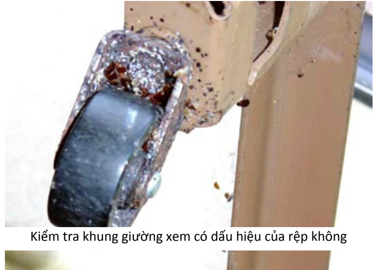
Kiểm tra khung giường xem có dấu hiệu của rệp không

Sau kiểm tra giường xong, tiếp tục kiểm tra đồ nội thất trong phòng. Tốt hơn, nên kiểm tra đồ nội thất lớn trước vì chúng có thể được đặt dựa an toàn vào tường, trong khu vực sạch, và các vật dụng khác có thể được đặt xung quanh đồ nội thất lớn hơn.