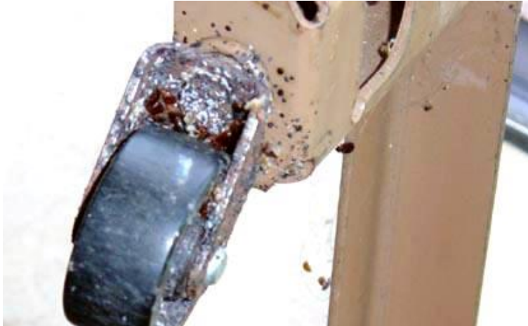
ابحث في اطار السرير عن اية علامات لبق الفراش

تحقق من جميع جوانب إطار السرير، حتى و ان كان ومسد السرير من المناطق المعروفة التي يمكن لبق الفراش أن يبدأ انتشاره منها. تحقق بعناية من جميع الأسطح، وانظر عن كثب في أي فتحات، ثقب المسامير و اي شقوق في الأثاث.