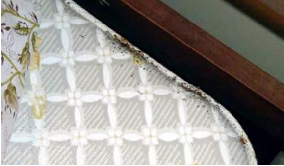
ابحث على طول حواف و زوايا الفرشة عن اية علامات لبق الفراش

صنف الملابس والمفراش، وغيرها من البنود التي يمكن غسلها. فكلما قلت الأغراض التي ستفحصها كلما كانت المهمة أسهل. لمزيد من المعلومات انظر الى: "غسل القطع لقتل بق الفراش".