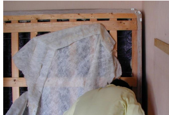
أزل القماش الفضفاض عند فحصك لقاعدة الفراش

كرر هذا البحث نفسه مع قاعدة الفراش. الفرق الوحيد هو أن قاعدة الفراش عادة ما يكون لها حواف بلاستيكية وقماش فضفاض مدبس على محيط الجانب السفلي. هذه الطبقات والحواف على الجانب السفلي من قاعدة الفراش عادة ما تكون مخايئ لبق الفراش. لضمان عدم وجود بق الفراش داخل قاعدة الفراش، يجب إزالة القماش الفضفاض والتحقق من الخشب، والشقوق، وثقوب المسامير الموجودة داخل القاعدة. بعد التنظيف، يمكن إعادة تدبيس القماش الفضفاض في مكانه.