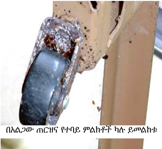
በአልጋው ጠርዝና የተባይ ምልክቶች ካሉ ይመልከቱ

ቅድሚያ በሚታይ ቦታ ላይ ባሉ ዕቃዎች ይጀምሩ። ሁሉም መዳዘኖችና ተደራሲዎችን ይመልከቱ። ሁሉም ክፍሎችና ክፍት ቦታዎች በጥንቃቄ ይመልከቱ። ዕቃው ከግንቡ ያንቀሳቀሱትና ጀርባውን ይመልከቱ። ከደጋፊ ቦርድ የሚያገናኝ ተደራራቢና ማንኛውም ቀዳዳዎችን ይመልከቱ።