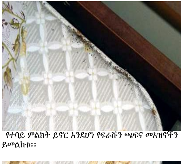
የተባይ ምልክት ይኖር እንደሆነ የፍራሹን ጫፍና መአዝኖችን ይመልከቱ።

የተባዮችን ፍለጋ በራስዎ ዕቃዎች ላይ ይጀምሩ። ምን እየፈለጉ እንደሆነ ያስታውሱ። ትላልቅ፣ ትናንሽ ተባዮች፣ እንቁላል፣ የደረቁ ቆዳዎችና ምልክቶች ያላቸው ቦታዎች። ተባዮቹ እንዴት እንደሚለዩ የበለጠ መረጃ ለማግኘት “ተባይ አግኝቻለሁ?” ( www.bedbugs.umn.edu/have-i-found-a-bed-bug ) የሚለውን ይመልከቱ።