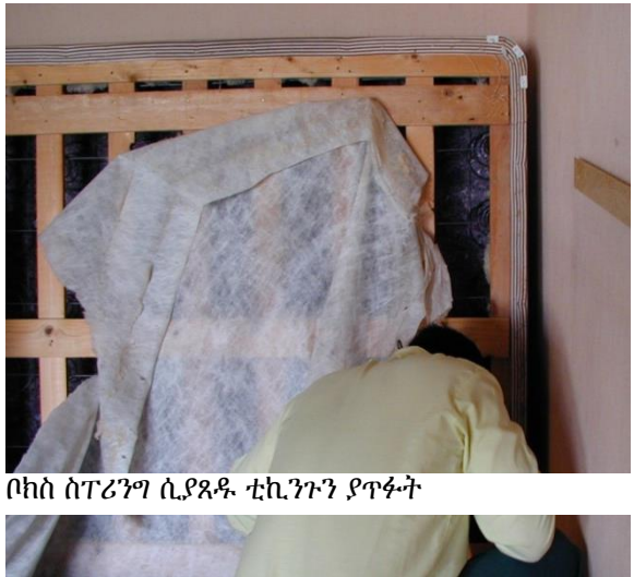
ቦክስ ስፕሪንግ ሲያጸዱ ቲኪንጉን ያጥፉት

ትራሶች፣ ቦክስ- ስፕሪንግ እና የአልጋ ፍሬምን ጨምሮ ከአልጋ ላይ ይጀምሩ። መጀመርያ የሚታዩ ነገሮችን ይዳስሱ። ሁሉም ጫፎችና ኮርነሮች ይመልከቱ። ሁሉም ጫፎችና የአልጋ ይዘታዎችን ይመልከቱ። ፍራሹ በአልጋው ላይ እያለ በአምስት ጎኖቹ ሊታይ ይችላል። የላይኛው ክፍል ማየት ከተጠናቀቀ በኋላ ፍራሹን በማቆም የታችኛው ክፍል ማየት ይችላሉ።