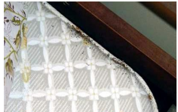
Осмотрите все края и углы матрасов в поисках следов клопов

Разместив инструменты под рукой, начинайте искать клопов. Помните, вы ищите: взрослых насекомых, молодых клопов, яйца, сброшенные оболочки и следы помета. Более подробная информация о том, как идентифицировать постельного клопа, содержится в разделе «Как определить клопа?» ( www.bedbugs.umn.edu/have-i-found-a-bed-bug ).