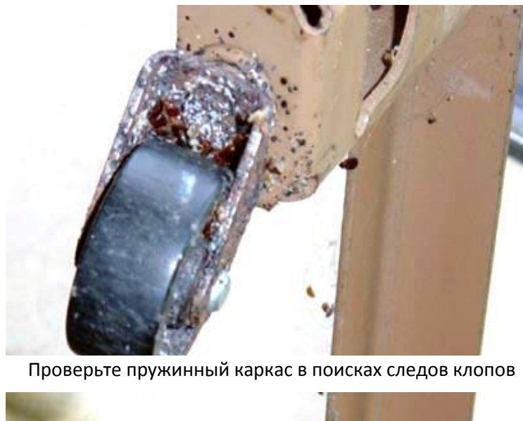
Проверьте пружинный каркас в поисках следов клопов

Закончив осматривать кровать, переходите к другой мебели, находящейся в комнате. Рекомендуется вначале осматривать крупные предметы мебели, потому что их можно надежно установить возле стены в чистой зоне, а затем разместить другие вещи вокруг крупной мебели.