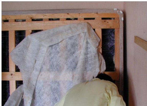
При проверке пружинного каркаса снимайте подстежку

Начните с кровати, включая матрас, пружинный каркас и раму кровати. Сначала осмотрите видимые области. Осмотрите все края и углы. Также проверьте все линии швов и ярлыки матраса. Матрас можно проверить с пяти сторон, не снимая его с кровати. Закончив проверять верхние поверхности, поставьте матрас в вертикальное положение, чтобы проверить низ матраса.